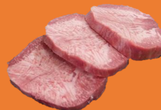
巴西一級牛舌心片 黑椒洋蔥碎 / 沙爹 / 香辣 / 麻辣