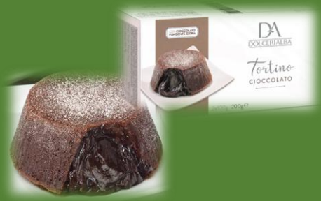
意大利心太軟(2件裝)