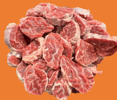
加拿大牛金錢展切片 海鹽黑椒 / 日本扒鹽 / 麻辣 / 蒜蓉