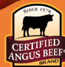
美國安格斯牛板扒 海鹽黑椒洋蔥 / 日本扒鹽