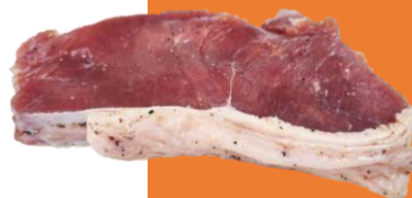
厚切2cm黑椒巴西西冷牛扒(原塊) 黑椒餐廳風味