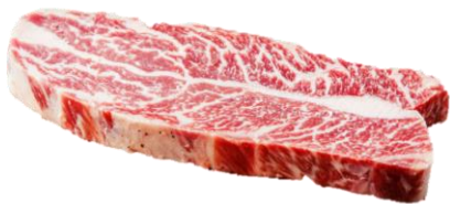
美國安格斯至極牛小排 海鹽黑椒 / 日本扒鹽