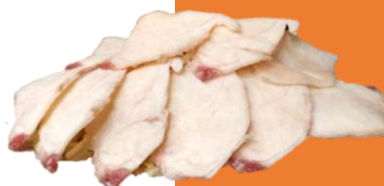
愛爾蘭薄切牛胸爽 黑椒洋蔥碎 / 沙爹 / 香辣 / 麻辣