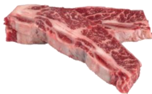
美國安格斯Choice級牛仔骨 海鹽黑椒洋蔥 / 日本扒鹽