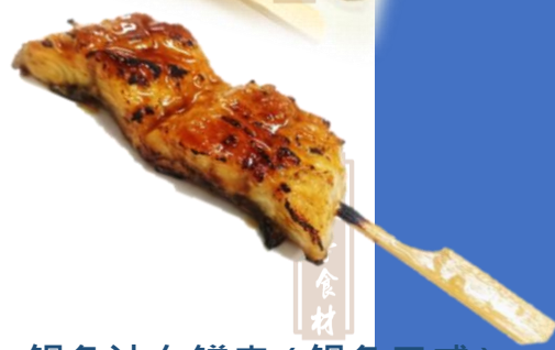
鰻魚汁白鱈串 ( 鰻魚口感 )