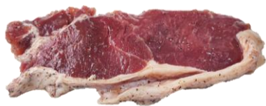
黑椒巴西西冷牛扒1cm厚(切件) 黑椒餐廳風味