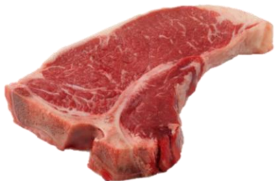
澳洲厚切T骨牛扒 黑椒洋蔥餐廳風味