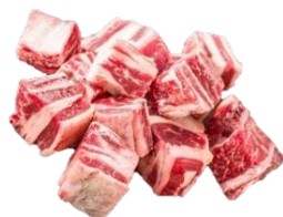
巴西一口牛肋粒 海鹽黑椒 / 日本扒鹽 加三色椒粒$10份