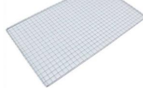
不銹鋼燒烤網 16 x 24寸