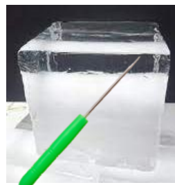
30磅冰磚 (非食用冰)紙箱裝配雪插一支