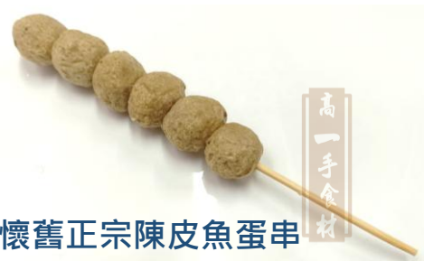
懷舊正宗陳皮魚蛋串